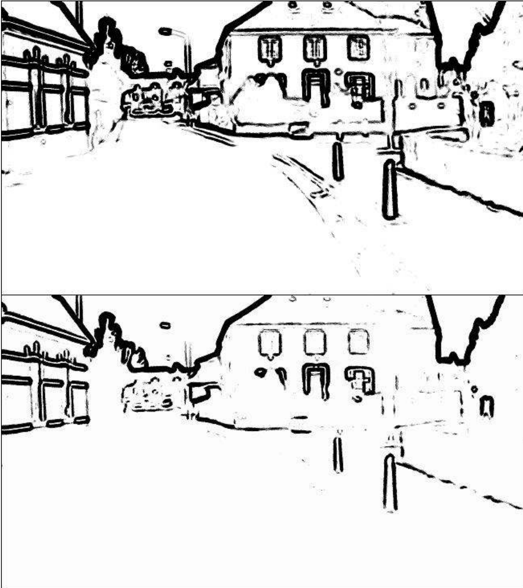
Figuur 2: IDED-analyse van foto 1: de bovenste figuur is gebaseerd op een gezichtscherpte van perifeer zicht (vanaf circa 10 graden vanaf het centrum van het gezichtsveld), de onderste op een verder verminderde gezichtsscherpte om verschillen in zichtbaarheid te illustreren