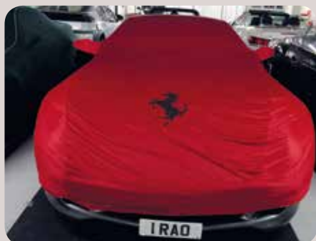
De tariefstelling is vergelijkbaar met het straat-parkeren, ook al lijkt de clientèle ongevoelig voor tariefstelling