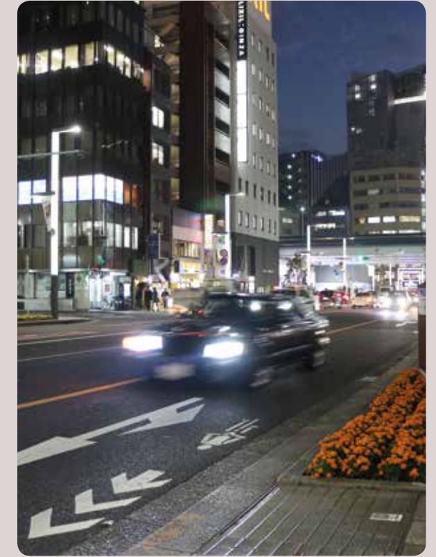
Onopvallend fietssymbool voor de wielen van een aanstormende auto.