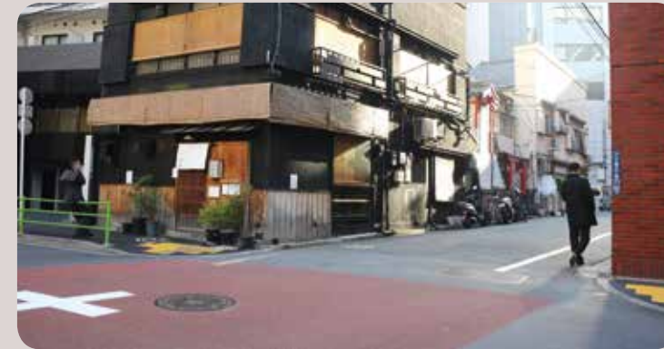
Achterafstraatje met kruis dat het midden van het kruispunt aangeeft.