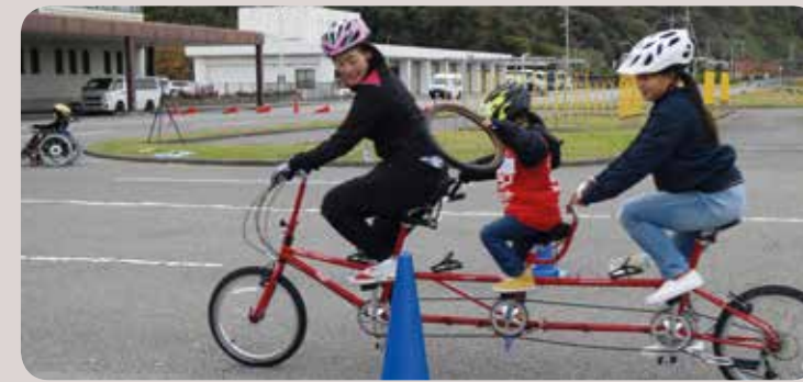
Wedstrijde ringwerpen op driezitstandem.