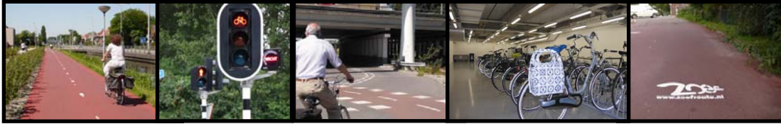
Afbeelding 3: Impressie gerealiseerde infrastructurele, servicegerichte en gedragsbeïnvloedende deelprojecten

Ook de komende jaren zal veel aandacht moeten worden besteed aan een goed beheer van deze projecten.