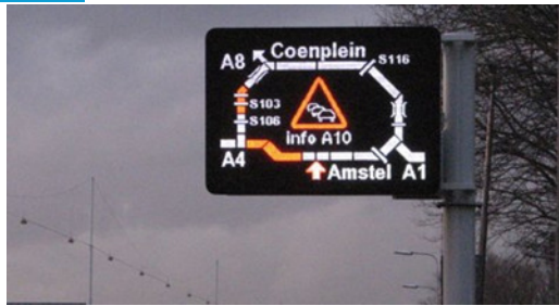
Figuur 1 Voorbeeld van een GRIP (Grafisch Route Informatie Paneel)

Doel van deze bijdrage is het geven van een overzicht van cognitief- en sociaal psychologische eigenschappen van ‘de weggebruiker’ aan de hand waarvan effectieve, voor de weggebruiker comfortabele en veilige verkeersmanagement maatregelen kunnen worden ontwikkeld die aansluiten op de eigenschappen van de weggebruiker.