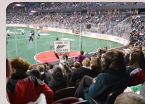
Roughnecks Lacrosse Game: wat een spektakel!